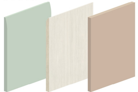
海灣 / 斜背 / 四E