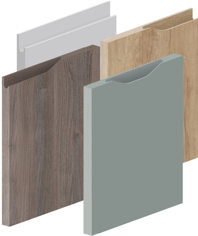
J / JL / JU / JR